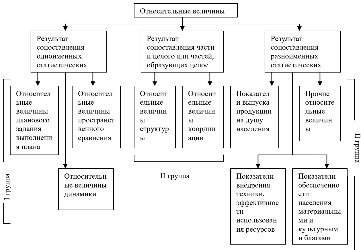
Рис 3.1. Классификация относительных величин

Первая группа относительных величин определяется сопоставлением одноименных статистических показателей. Ее результатом является кратное отношение (коэффициент), показывающее, во сколько раз сравниваемая величина больше (или меньше) базисной. Результат может быть выражен в процентах, если база сравнения, принятая за 100, показывает, сколько процентов сравниваемая величина составляет от базы.