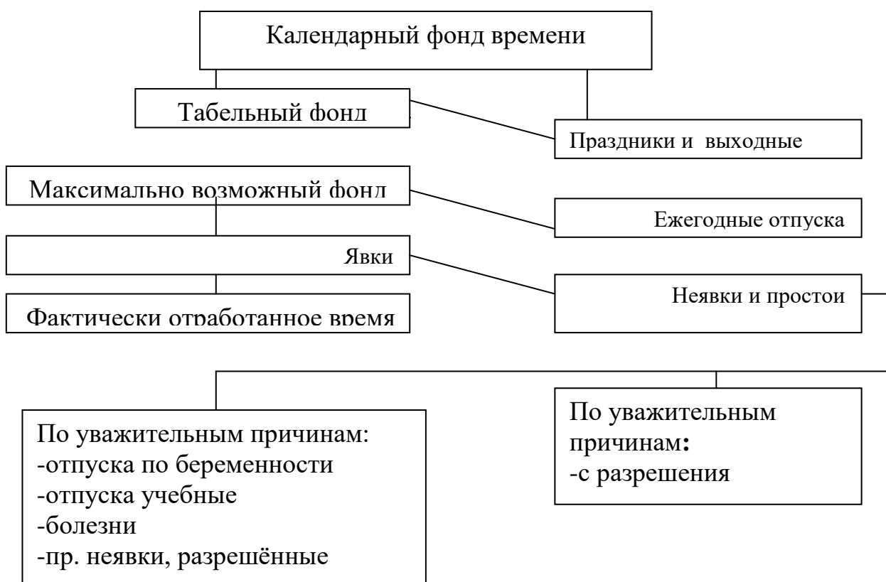
Рис. 4.1 Структура календарного фонда времени

Структура календарного фонда времени как исходного показателя для определения фонда рабочего времени представлена на рис 4.1: